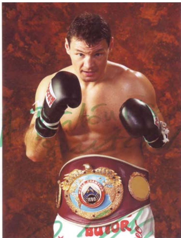
Madár köszönti a Börtönújság olvasóit