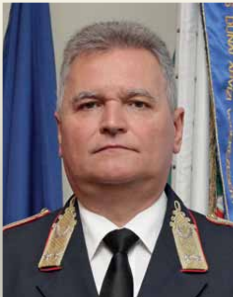
◀ TOLLÁR TIBOR tűzoltó vezérőrnagy, a BM Országos Katasztrófavédelmi Főigazgatóság megbízott főigazgatója

A katasztrófavédelem és a büntetés-végrehajtás a közös minisztériumi vezetésen kívül is napi kapcsolatban áll egymással. A katasztrófavédelem számos terméket, szolgáltatást vásárol a büntetés-végrehajtástól, elég csak az egyenruházatra gondolni, de azokat a homokzsákokat is ott gyártják, amelyeket az árvizekkor használunk. És ha már árvíz: nem szabad elfelejteni azt a jelentős munkát, amelyet a fogvatartottak végeztek a három évvel ezelőtti áradásnál – nem csak rakták, ültették is a homokzsákokat, óriási szorgalommal, kitartóan.