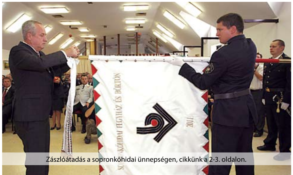
Zászlóátadás a sopronkőhidai ünnepségen, cikkünk a 2-3. oldalon.

A szeptember mindig kitüntetett hónap a bv. szervezet életében, hiszen Szent Adorján napján a nagy felelősséggel járó napi munka mellett kicsit több figyelmet kapunk, de magunkra és egymásra is jobban figyelhetünk. E hasábokon felidézzük a sopronkőhidai ünnepség és az immár hagyományos családi napok eseményeit, legjobb pillanatait. Jó szívvel közöljük az augusztus 20. és az Adorján-nap alkalmából kitüntetést, elismerést kapott kollégák névsorát is.