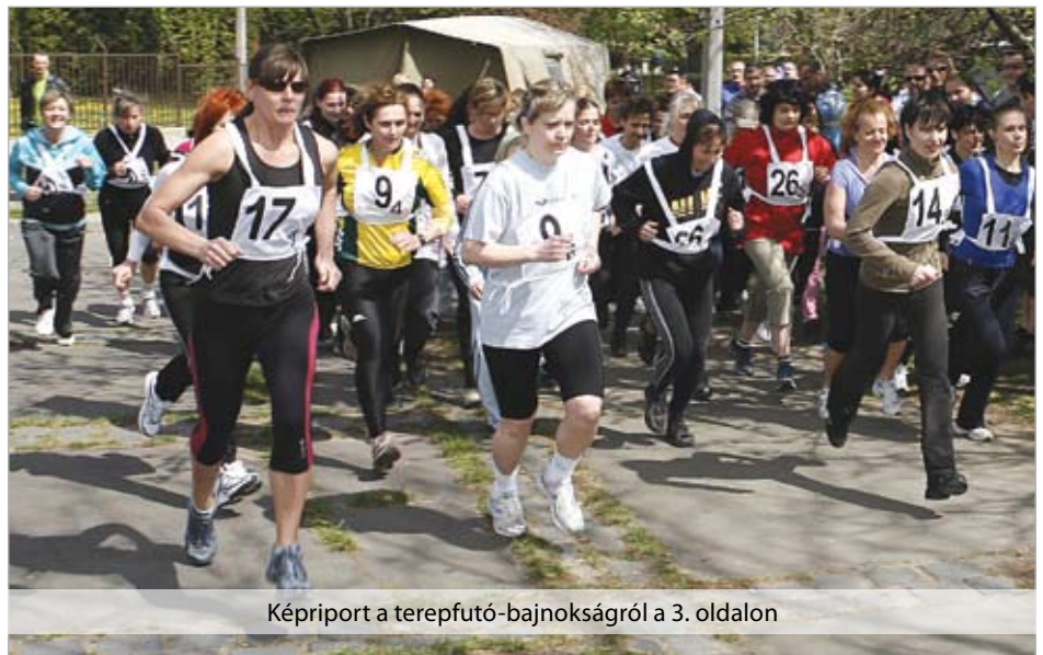
Képriport a terepfutó-bajnokságról a 3. oldalon

Március 15-e alkalmából sok munkatársunk kapott kiemelkedő munkavégzéséért kitüntetést, elismerést. Ott voltunk a központi ünnepségen és az elismerések átadásán.